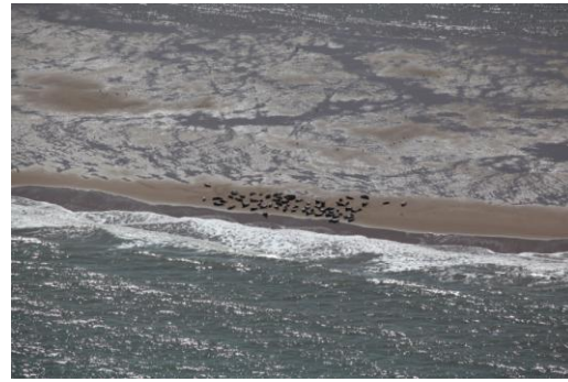
Carte des observations de mammifères marins réalisées en effort au cours de la session 1 - avril 2017 (à gauche), et colonie de phoques sur les bancs Goodwin Sands au large de Douvres (à droite)